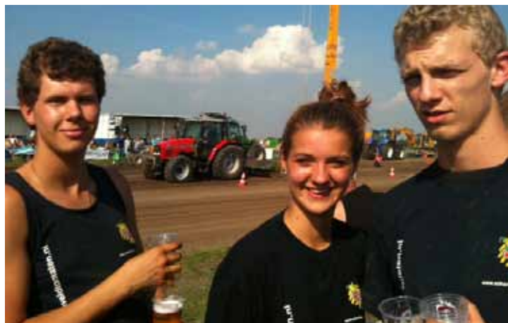
Schenkevelders op de Trekkertrek. Volgend jaar meedoen met de heftruck?